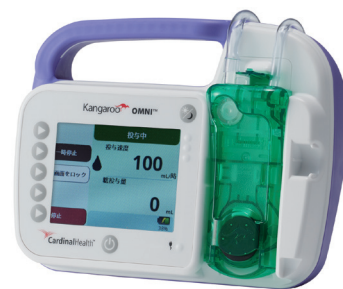
販売名：カンガルー OMNI ポンプ 一般的名称：経腸栄養用輸液ポンプ 医療機器承認番号：30500BZX00190000