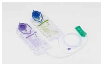
高粘度栄養剤フィード&フラッシュタイプ