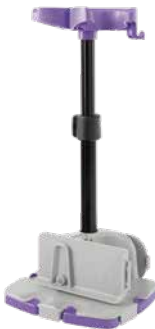
テーブルスタンド

「バックパックのみ」「テーブルスタンドのみ」 「バックパック+テーブルスタンド」の中から、 ご希望の組み合わせをお選びいただけます