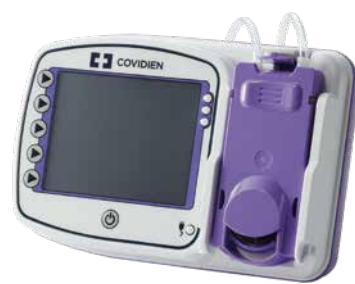
カンガルー Connectポンプ™