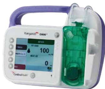
カンガルー OMNI™ ポンプ