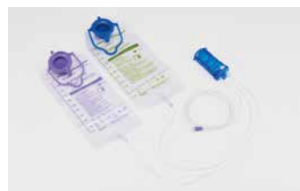
フィード&フラッシュタイプ