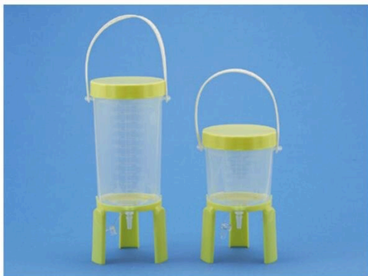
カタログ番号: 3613-12P 3613-6P