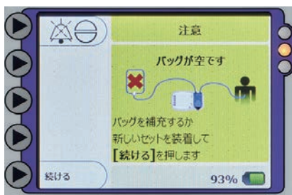
● 黄色：アラーム画面(注意)